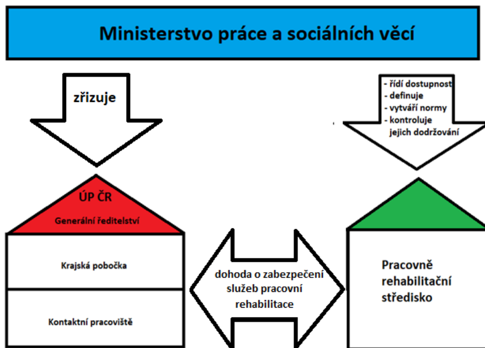
Obr. č. 1: Kompetenční schéma

PRSt spolupracuje s ÚP ČR při zabezpečení PR v rozsahu § 69 – 74 zákona o zaměstnanosti, a to v uvedených oblastech za níže specifikovaných podmínek.